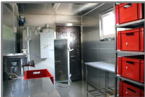
ФОТО МОДУЛЬНЫХ ЦЕХОВ