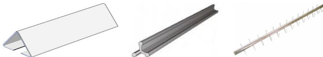
СТЕЛЛАЖИ ДЕФРОСТАЦИИ (РАЗМОРОЗКИ)