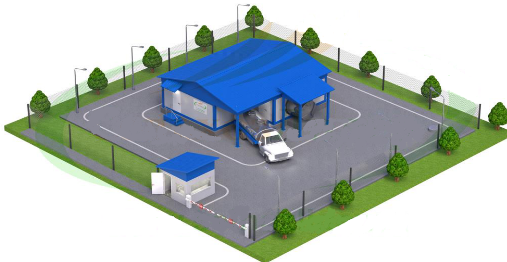
Схема размещения и состав оборудования мини-завода